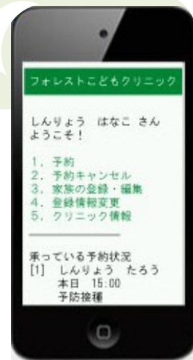
専用モバイルサイト(イメージ)