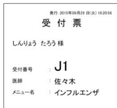
幅 80 mm