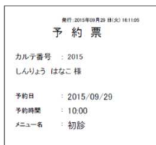
幅 80 mm