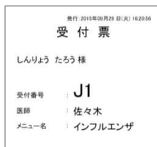
幅 80 mm