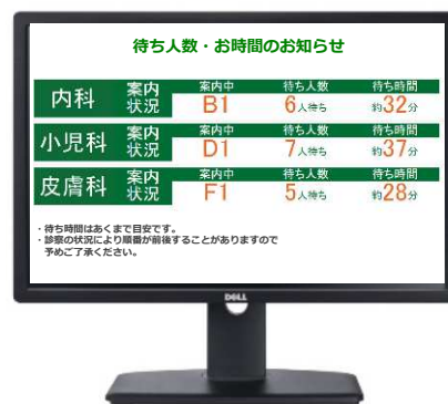
受付で予約システムを使用するパソコンに外付けモニターを1台接続して利用します

院内にディスプレイを設置し、患者さんに現在の待ち人数や待ち時間を表示させることができます。ネットから順番待ちができない患者さんも、おおよその待ち時間がわかるのでイライラの解消に効果があります。