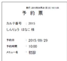
幅 80 mm